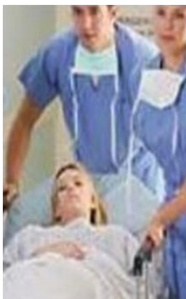
شکل ۳: در صورت تشخیص حاملگی خارج رحمی در بیمار عمل جراحی انجام می شود.

*درمان طبی در موارد خاص، با دارو و کنترل دقیق علائم بالینی و حیاتی، در بیمارستان قابل انجام است.