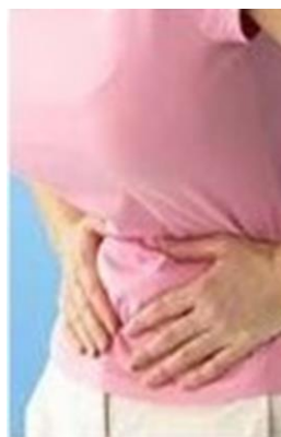
شکل ۲: درد شکم که رایج ترین شکایت پس از بروز حاملگی خارج رحمی است.

رایج ترین شکایت حاملگی خارج رحمی درد شکمی است. شدت درد متغیر است و ممکن است یک طرفه یا دوطرفه، در قسمت تحتانی شکم احساس شود.